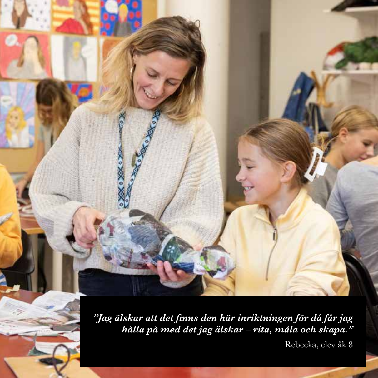
Bild & Form

Profilen "Bild & Form" är en bred och kreativ utforskning av olika material och uttryckssätt. Som elev här får du chansen att utforska skapande genom att rita, måla, fotografera, filma och mycket mer. Vi främjar arbetet i profilen både individuellt och i grupp genom hela skoltiden.