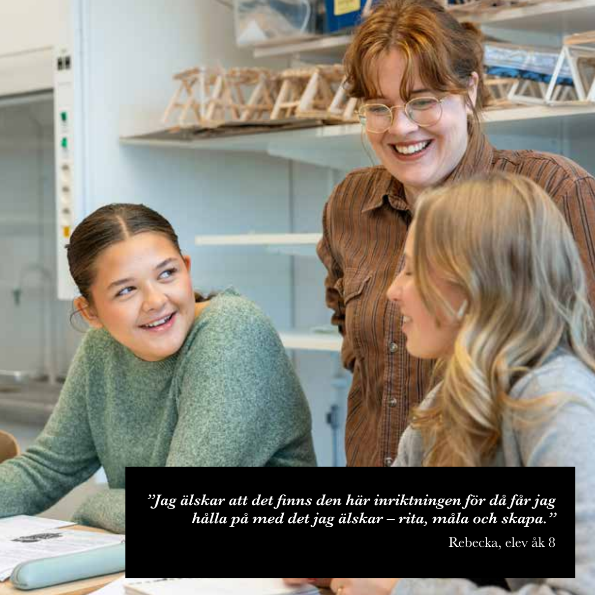
Bild & Form

Profilen "Bild & Form" är en bred och kreativ utforskning av olika material och uttryckssätt. Som elev här får du chansen att utforska skapande genom att rita, måla, fotografera, filma och mycket mer. Vi främjar arbetet i profilen både individuellt och i grupp genom hela skoltiden.